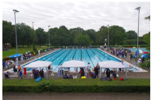
Das Wettkampfbecken der Landes-Masters