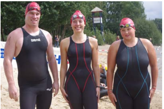
Die SVL-Aktiven in Altwarmbüchen am Samstag (oben) und Sonntag (unten)